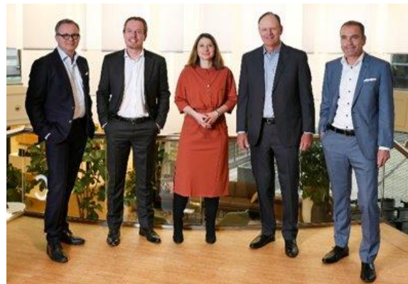
Consejo de Administración (Executive Board) De Lage Landen International B.V. Noviembre de 2020

Este Código de conducta se basa en los valores centrales de nuestra empresa, los cuales forman parte de nuestra cultura y ADN de DLL. Ayuda a guiar a todos nuestros miembros sobre cómo hacer negocios en la forma correcta y nos ayuda a entender y a seguir las reglas básicas de cumplimiento e integridad.